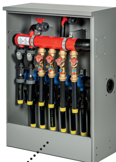
Avtakbar plate for enkel installasjon.