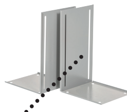
Høydetilpassbare ben for innstøping i betong.