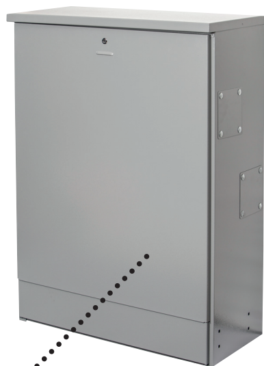
Luke med EBR-lås.